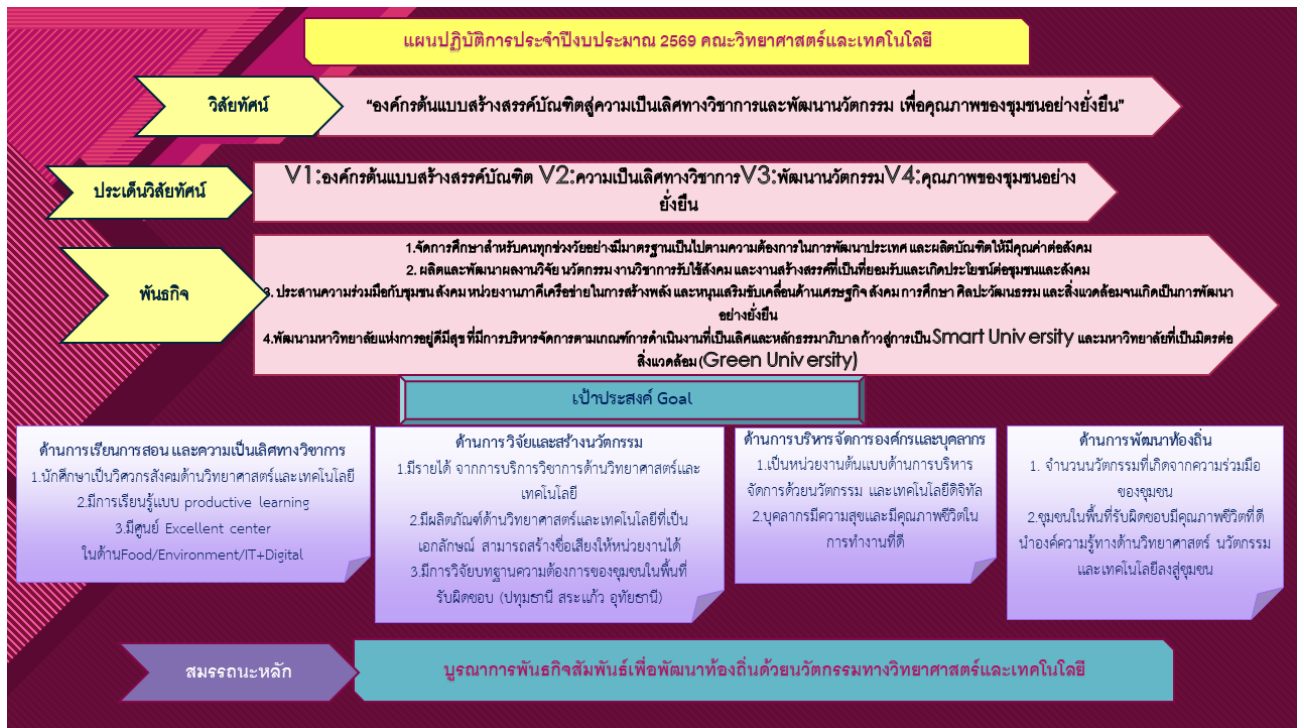
แผนภาพแสดงวิสัยทัศน์และเป้าประสงค์ของคณะวิทยาศาสตร์และเทคโนโลยี