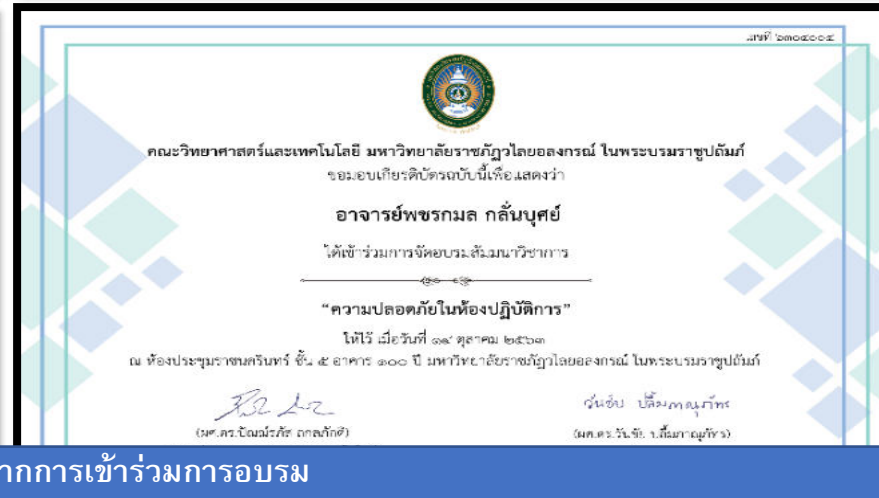
ตัวอย่างเกียรติบัตรจากการเข้าร่วมการอบรม