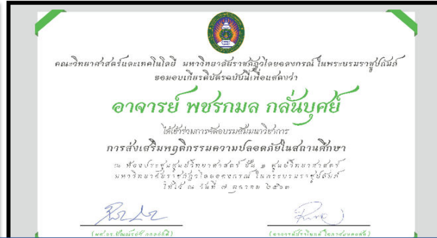
ตัวอย่างเกียรติบัตรจากการเข้าร่วมการอบรม