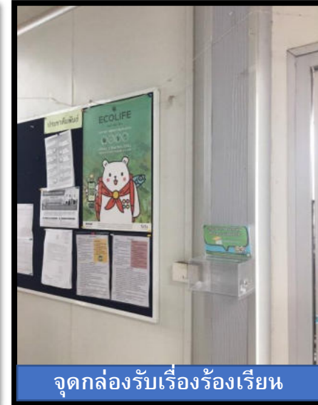
จุดกล่องรับเรื่องร้องเรียน