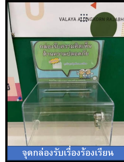
จุดกล่องรับเรื่องร้องเรียน