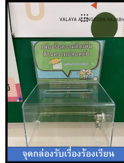
จุดกล่องรับเรื่องร้องเรียน