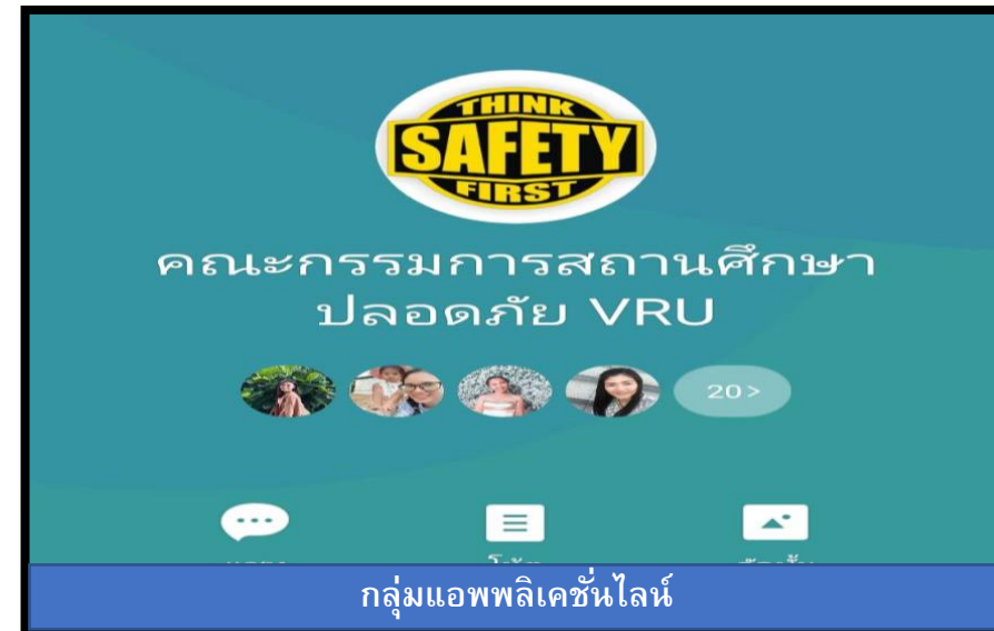
กลุ่มแอปพลิเคชันไลน์