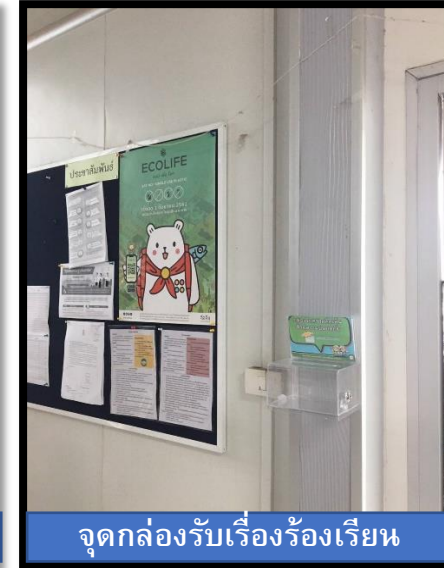
จุดกล่องรับเรื่องร้องเรียน